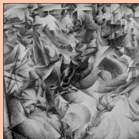
U. Boccioni, Elasticità (1912), Milano, Collezione Jucker